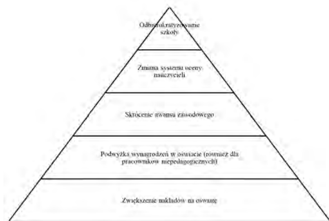
Rysunek 1. Postulaty strajkowe

nauczycieli jest niski status zawodu przy jednoczesnym obarczaniu go wysokimi oczekiwaniami społeczeństwa. Wiele osób zapomina, że zwiększenie pensji w oświacie nie jest bynajmniej jedynym postulatem strajkujących, lepsze warunki płacowe mają być pierwszym krokiem na drodze do podniesienia nadszarpniętego prestiżu zawodu. Za pomocą strajku nauczyciele sygnalizują problemy strukturalne polskiej oświaty. Postulaty związków zawodowych można przedstawić za pomocą poniższej grafiki. Należy przy tym zastrzec, że część z postulatów zostało przejęte od strony rządowej.