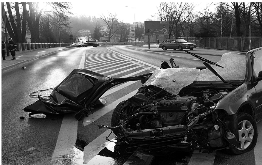
Wypadek w sanoku 1.04.07r., 4 osoby zginęły