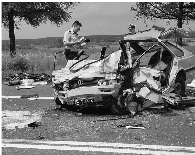
Kierowcy samochodów osobowych w 2007 r. spowodowali w woj. podkarpackim 1357 wypadków drogowych