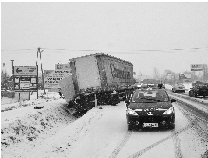
Kierownicy samochodów ciężarowych spowodowali w naszym województwie 120 wypadków, w których zginęło 12 osób, a 178 zostało rannych