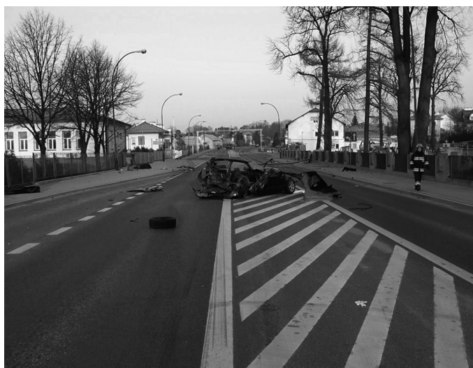
Przyczyną wypadków jest wciąż brawura kierowców i nadmierna prędkość