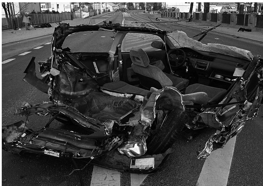
Na drogach Podkarpacia w 2007 r. śmierć poniosło 257 osób